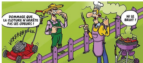
Les nuisances sonores

Avec les beaux jours, les bruits et nuisances liés à l'activité extérieure sont également de retour. A ce propos, la Mairie a déjà reçu plusieurs signalements d'abus par des habitants.