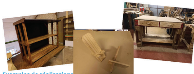
Exemples de réalisations

Recycler des palettes en bois a un impact positif sur l'environnement (le principe est de réutiliser au lieu de jeter) et est économique. Elles offrent des possibilités de transformations infinies. Chez O2Meuse, les bénévoles créent au gré de leur imagination et savoir faire.